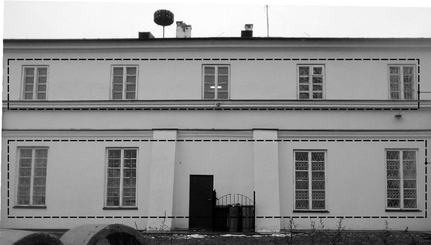
okna Ok-1 - 5szt