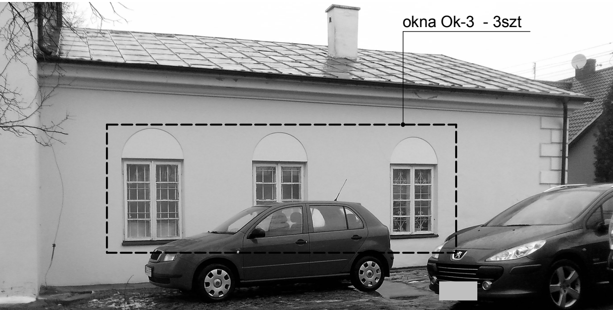
okna Ok-3 - 3szt