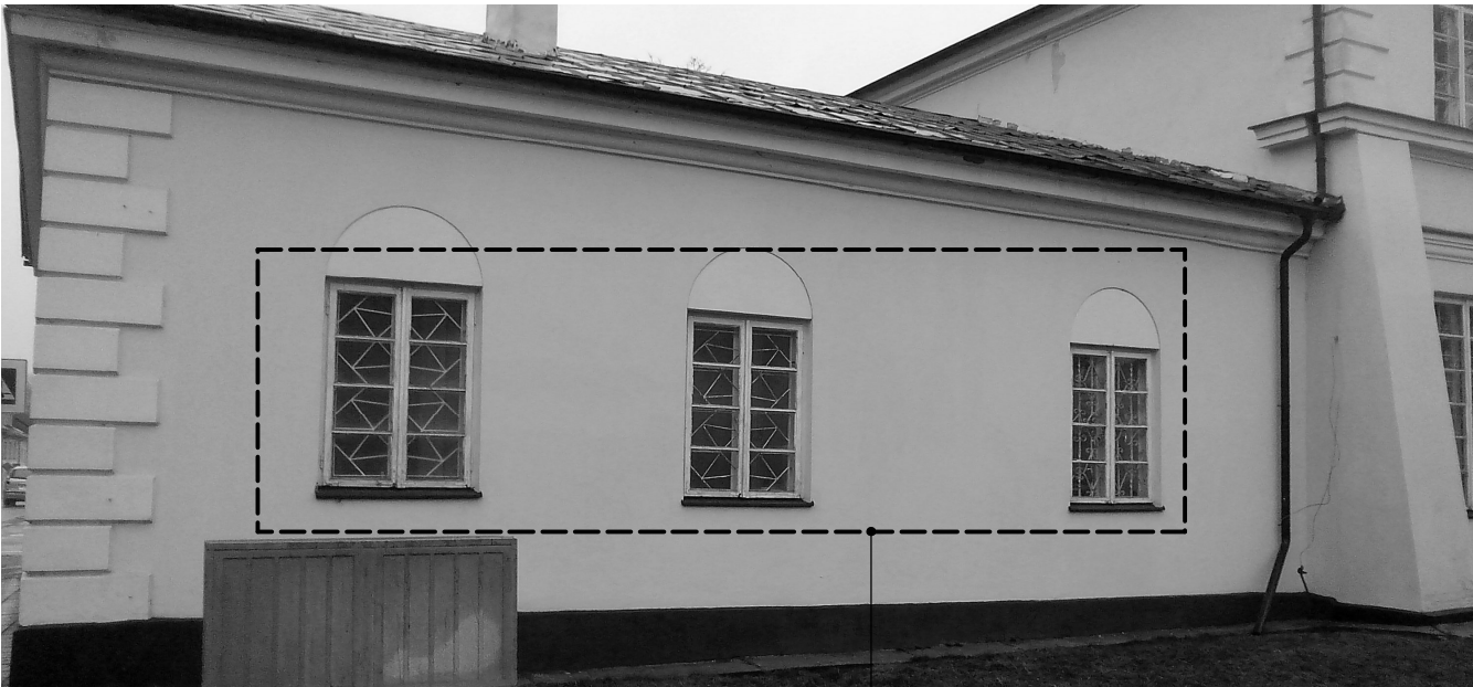
okna Ok-3 - 3szt